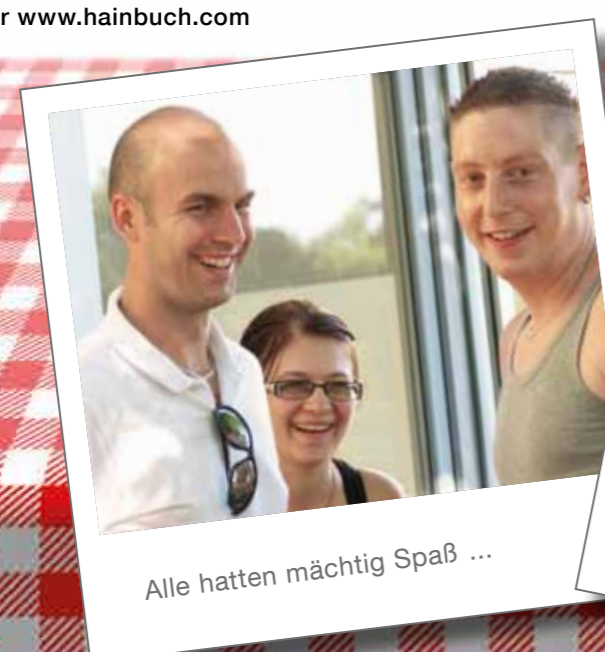
Alle hatten mächtig Spaß ...