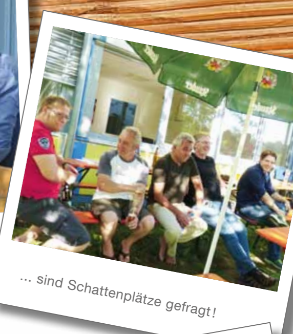
... sind Schattenplätze gefragt!