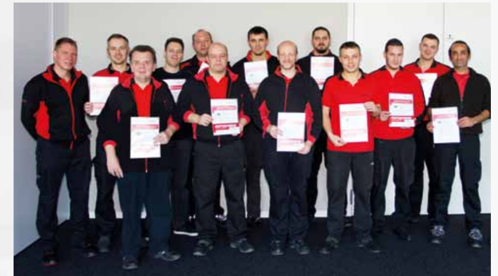
▲ Wir gratulieren den frisch gebackenen Qualitätscoaches zum Zertifikat.