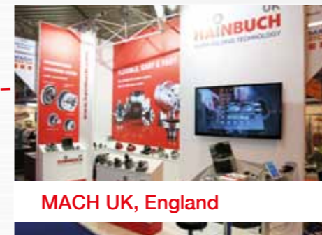
MACH UK, England