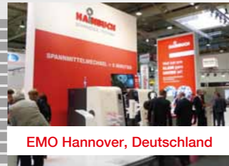
EMO Hannover, Deutschland