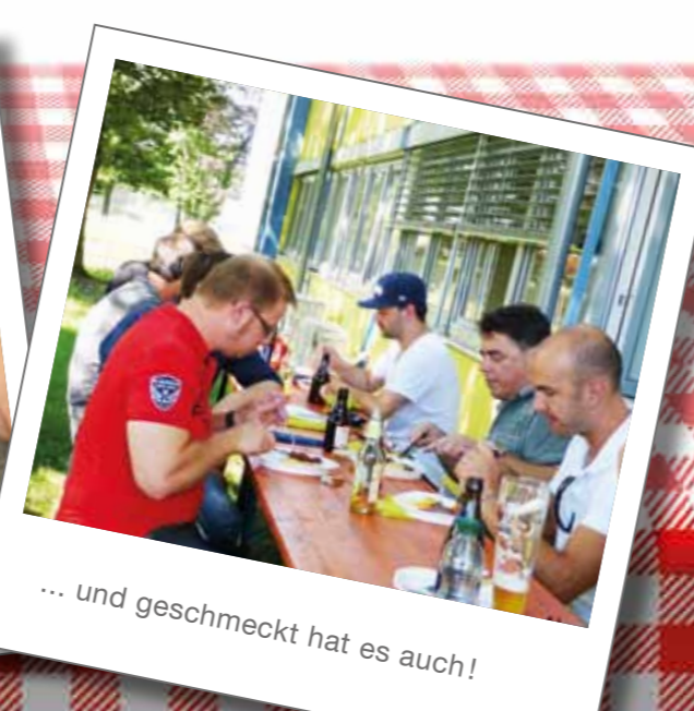
... und geschmeckt hat es auch!