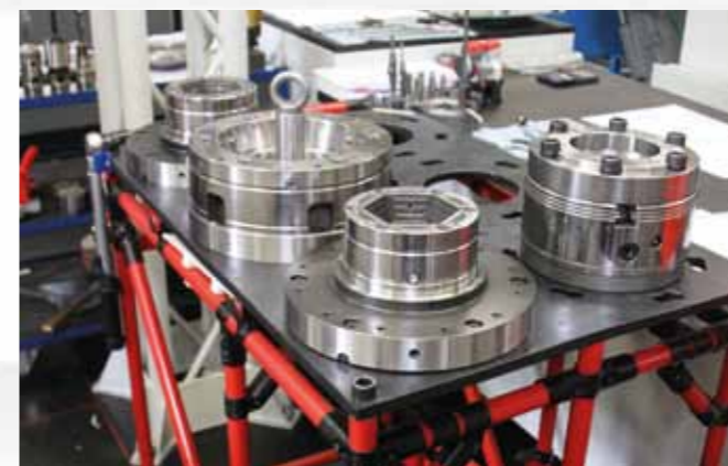
Auf dem Wagen sind die Spannmittel sicher platziert und können von dort per Kran direkt transportiert werden.

von 3,5 Stunden auf weniger als 1,5 Minuten