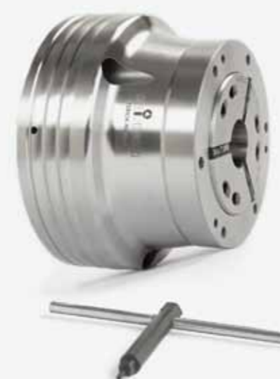
◀ Die Variante TOROK RD Größe 65 ist in der neuen Version bereits am Lager – die anderen Größen und Ausführungen sind derzeit noch in Arbeit.

Gut war der TOROK schon immer, jetzt ist er noch besser. Wir haben unserem beliebten Handspannfutter ein Upgrade verpasst, das es zu einer echten Alternative für Schleifmaschinen macht. Satt vier Kilo hat der Kleine »abgespeckt« und schlank ist auch seine Bauweise. Zusammen mit der geringen Störkontur und dem neuen, feinfühligere Getriebe wird das »Von-Hand-Spannen« jetzt noch komfortabler. Den Unterschied merken Sie sofort. Ganz abgesehen davon, dass er wie alle unsere Produkte perfekt auf unser Baukasten-System abgestimmt ist. Und natürlich ist und bleibt der TOROK im Werkzeugbau und in Schulungszentren nach wie vor eine gute Wahl oder sogar eine der Besten – aber das können nur Sie uns sagen.