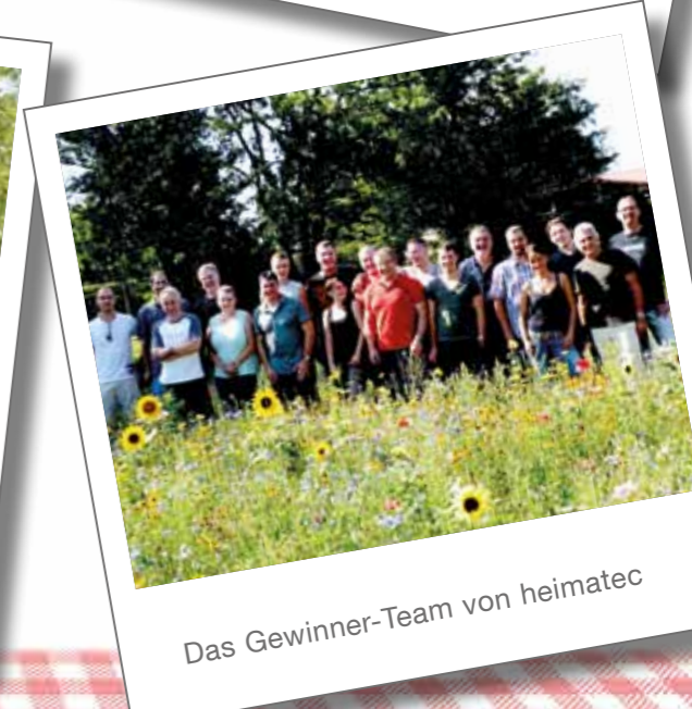
Das Gewinner-Team von heimatec