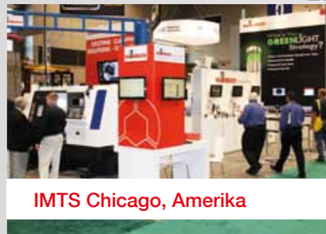
IMTS Chicago, Amerika