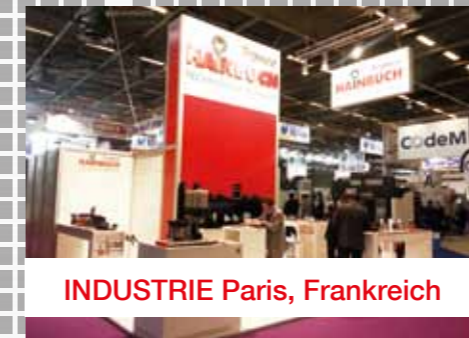
INDUSTRIE Paris, Frankreich