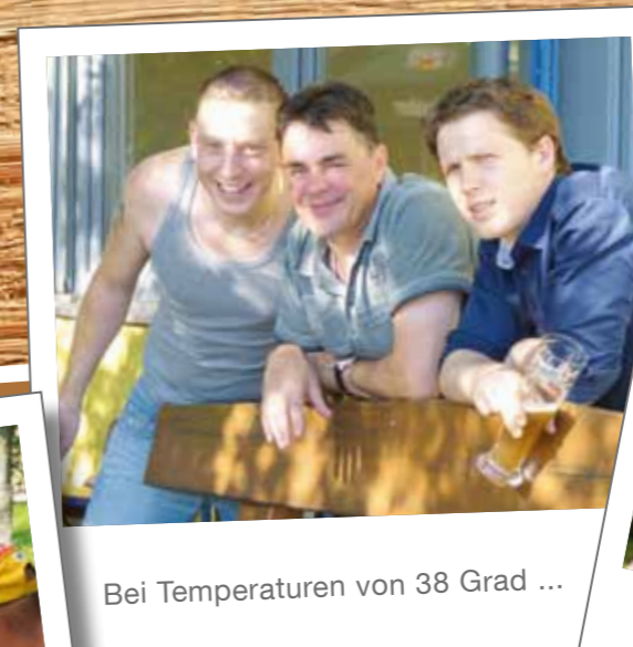
Bei Temperaturen von 38 Grad ...