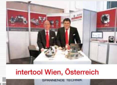
intertool Wien, Österreich