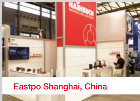
Eastpo Shanghai, China

Auf der ganzen Welt gibt es Messen, an denen unsere Handelspartner und wir teilnehmen. Besuchen Sie uns doch mal auf einer. Dort erhalten Sie aus erster Hand umfassende Informationen über unsere Spannmittel und deren vielfältige Einsatzmöglichkeiten. Dabei erkennen Sie uns ganz einfach am roten »Look«.